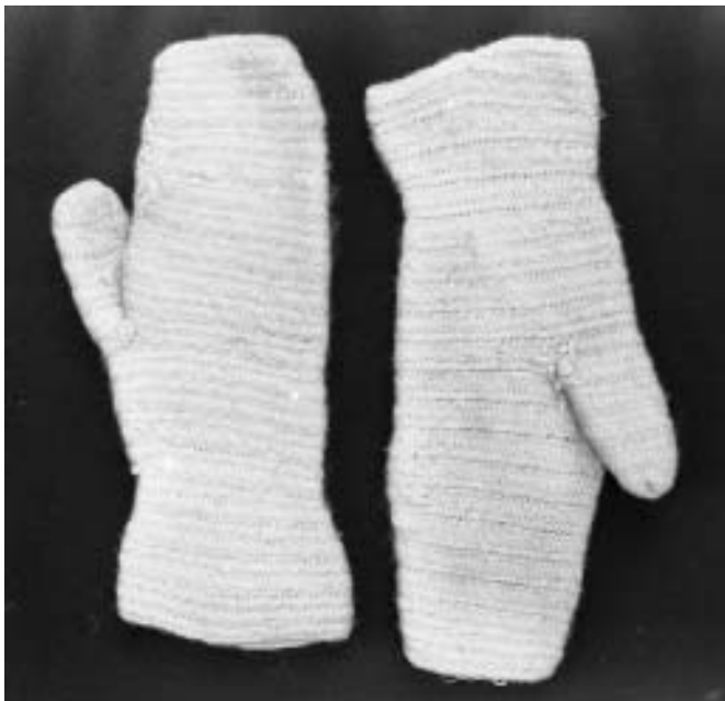
Syvantar Vallen Mårdaklev, bild 17 B i Älvsborgs läns Hemslöjdsförbunds inventering 1978.

Under föregående läsår har jag i min B-uppsats i historia vid universitetet i Karlstad försökt att spegla den verksamhet med syvantar som bedrevs i Mårdaklev under de två sista decennierna av 1800-talet och då mer bestämt arbetarnas situation vad avser löner och levnadsomkostnader. Under min studie av förläggarverksamheten med syvantar har jag fått en djupgående insikt om traktens förenade arbete för överlevnad i en svår tid men också en allestädes närvarande flit och förmåga att se de möjligheter till försörjning som stod till buds för befolkningen i dessa trakter.