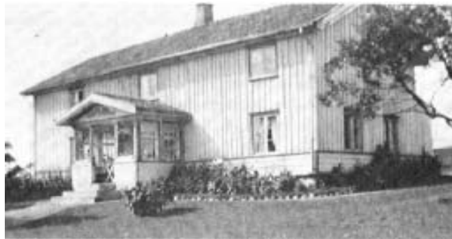
Risagården / Mårdaklevs Naturskyddsförening.

och tekniken är flera tusen år gammal. Den äldsta bevarade vanten i Sverige tillverkad i denna teknik är från 200-300 e.kr. Det är den så kallade "Åslevanten", som hittades på 1920-talet i Åsle mosse i Västra Götaland